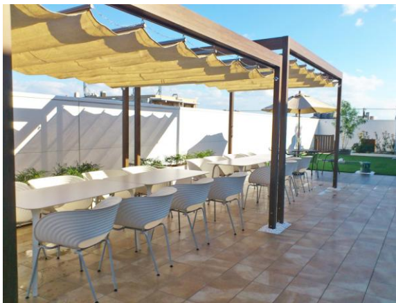
商談、ミーティング、会議に使用 (全 36 席)