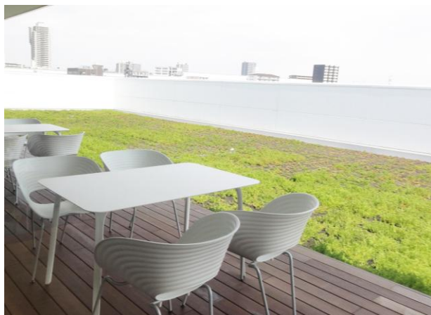
施工前の屋上テラス

HCCは、屋上テラスを働く場や社内外コミュニケーションの場として活用することで、新たなワークスタイルの提案を発信するとともに、より一層創造性に富んだ商品やサービスを社会に提供してまいります。