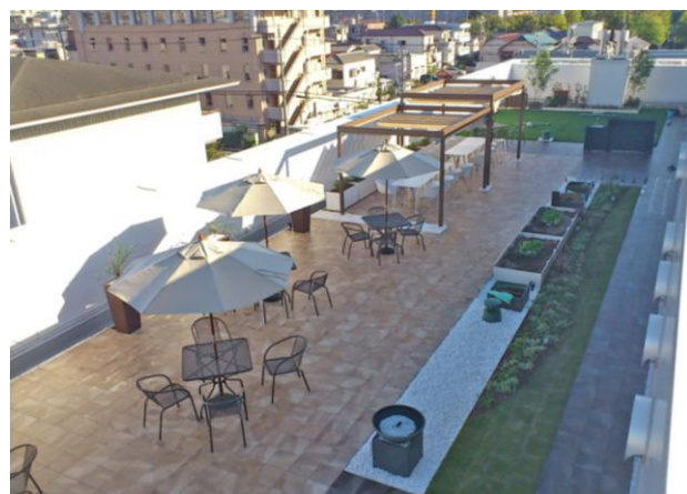
施工後の屋上オフィス