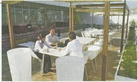
会議やイベント会場として大規模改装したアッシュ・セー・クレアシオンの本社兼工場―兵庫県西宮市